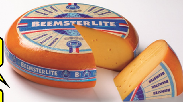
LITE gerijpt 1/1 of 1/2