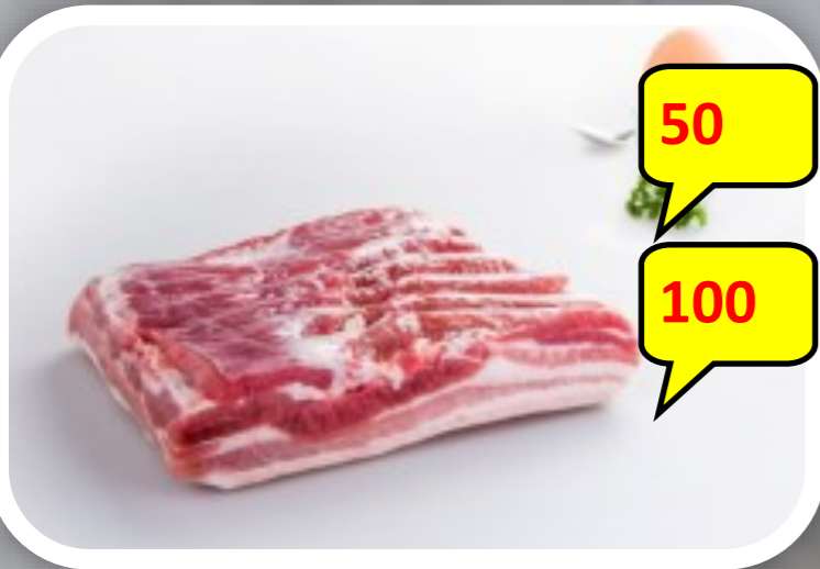
Gezouten spek 1/1 of 1/2