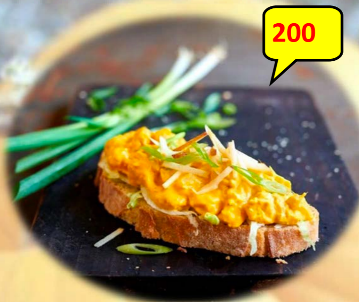
Sinterklaassalade 2 kg