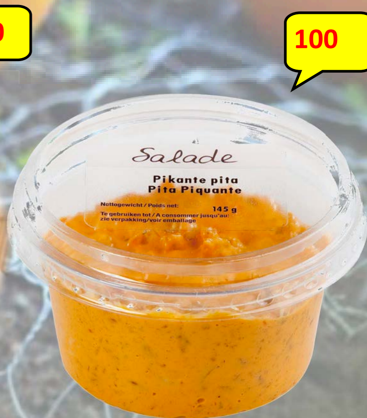
Pita pikant 6 x 145 gr